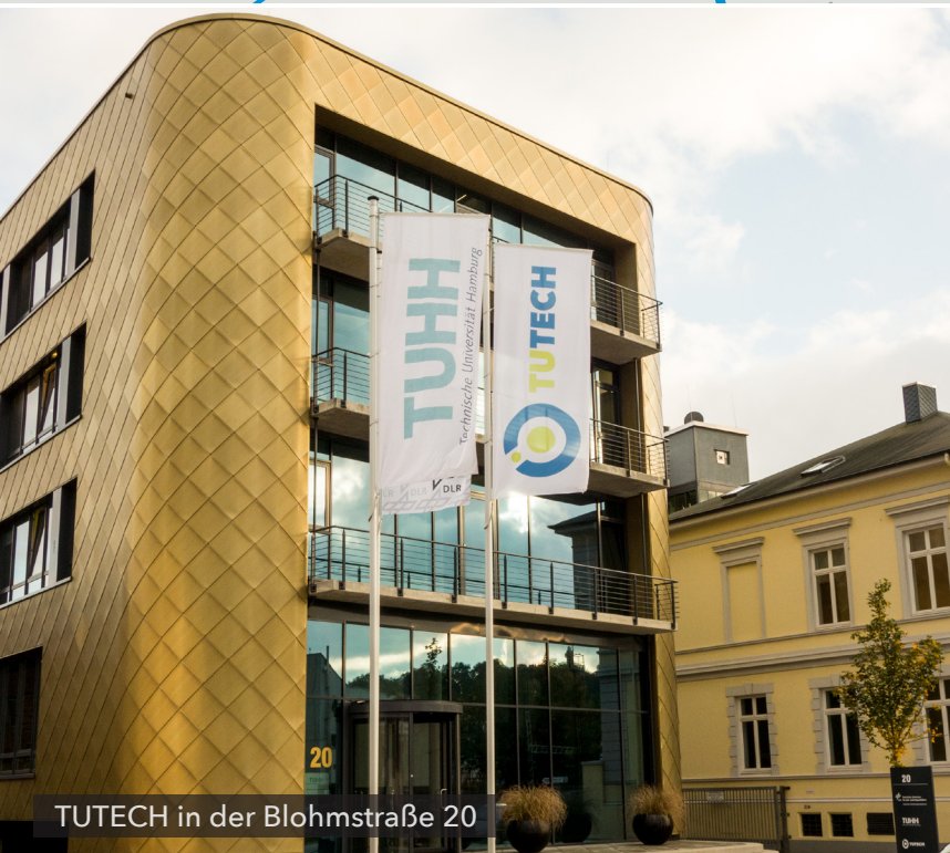
TUTECH in der Blohmstraße 20