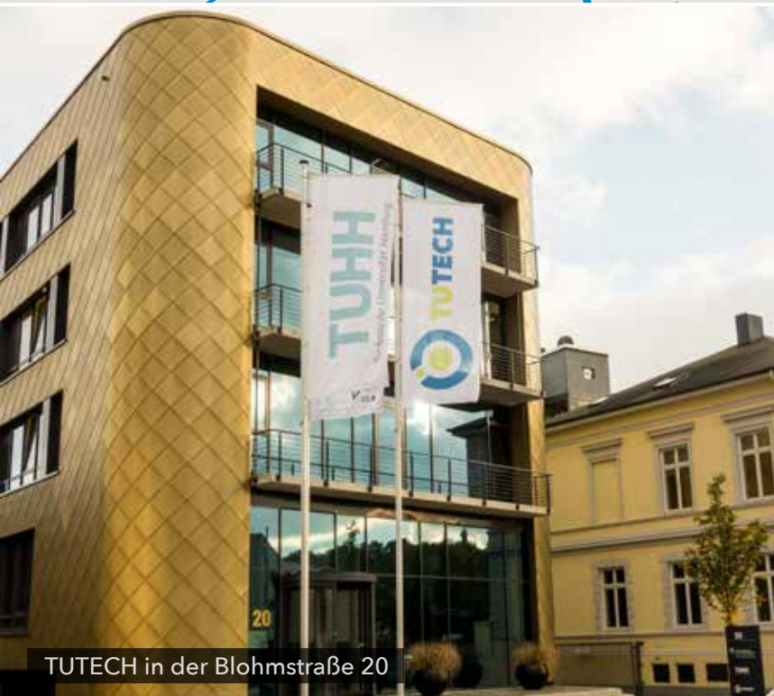
TUTECH in der Blohmstraße 20