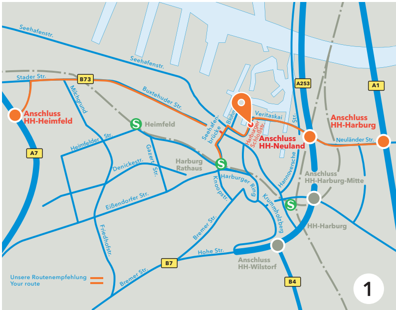
Auf unserer Webseite finden Sie in der Fußzeile die Wegbeschreibungen zu allen Standorten.